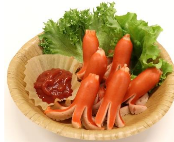
タコさん盛り合わせ