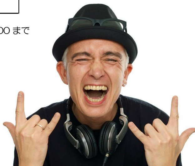
マーク・パンサー