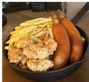
おつまみワンプレート ※ナイト営業日 17 時～販売