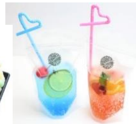
スカッシュドリンク