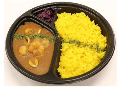
シーフードカレー