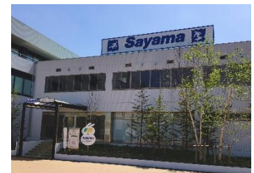
※画像はすべてイメージです