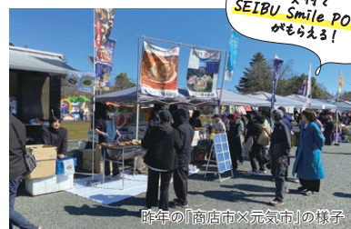
昨年の「商店街×元気市」の様子