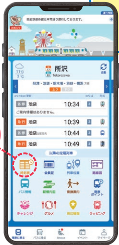
「西武線アプリ」トップ画面イメージ

「マイ駅」登録した駅の時刻表がいつでもどこでもご覧いただけます。リアルタイムな運行状況もすぐわかる「西武線アプリ」をぜひご利用ください!