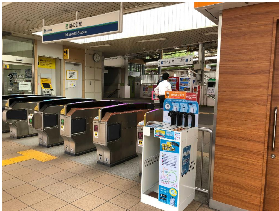
「アイカサ」レンタルスポット(写真は国分寺線鷹の台駅)