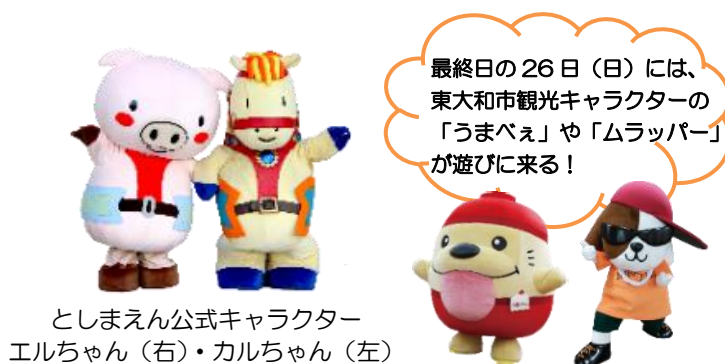
としまえん公式キャラクター エルちゃん(右)・カルちゃん(左)

また6月25日(土)・26日(日)には、パフォーマー達によるバルーンアートやマジックショー、キャラクターのグリーティングなども実施いたします。