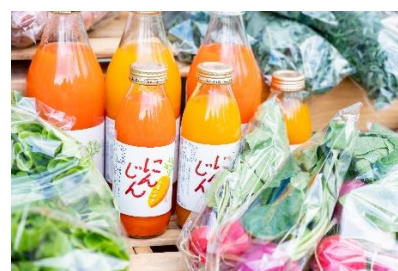
西武グリーンマルシェ ポップアップ店舗イメージ