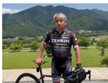
JCL チェアマン 片山右京