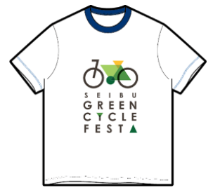
スタッフTシャツイメージ