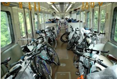
サイクルトレインイメージ