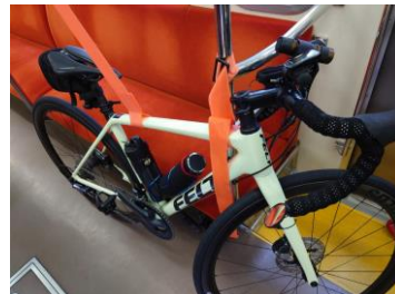
車両への固定方(イメージ)