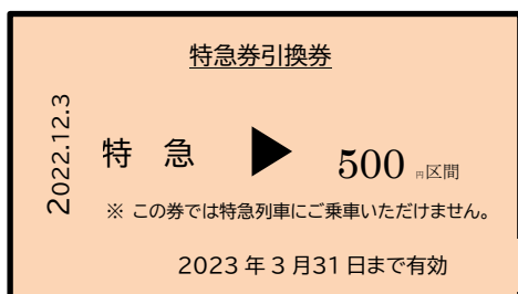
特急券引換券イメージ