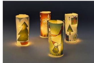
ぬり絵シート・キャンドルの装飾(イメージ)