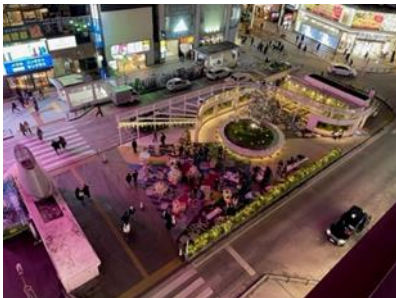
JR 新宿駅東口駅前広場

小田急電鉄株式会社、京王電鉄株式会社、西武鉄道株式会社、東京地下鉄株式会社、東日本旅客鉄道株式会社は、「Candle Night @ Shinjuku 2022 -新宿想い線-」を、2022年12月16日（金）、17日（土）にJR新宿駅東口駅前広場にて、12月23日（金）、24日（土）に新宿中央公園「水の広場」にて開催します。このイベントは、交流・連携・挑戦をテーマとする「新宿グランドターミナル」の実現に向けて、これから生まれ変わっていく新宿を多くの方に訪れていただきたいという想いから、鉄道5社が揃って実施するものです。