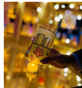
キャンドル装飾体験 (昨年の様子)