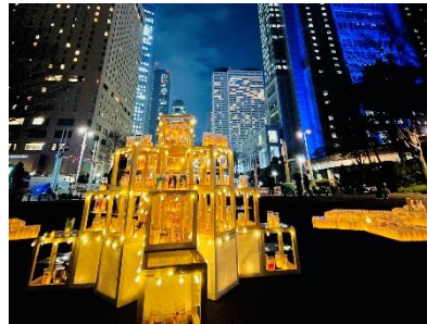
新宿中央公園「水の広場」