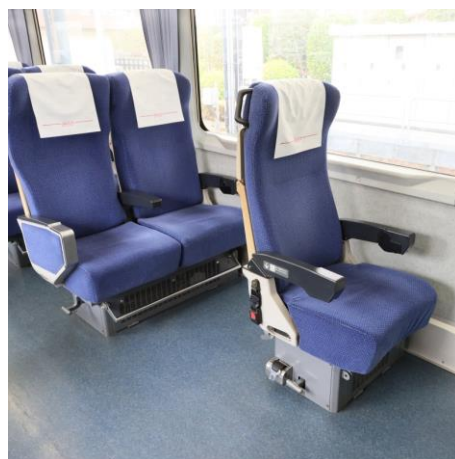
特急レッドアロー号 車いす対応席