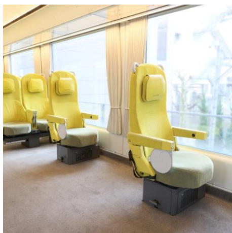
特急ラビュー 車いす対応席

※車いす対応席および介護席は、車いすをご利用のお客さまと同行するお客さまにご利用いただくために ご用意している座席です。