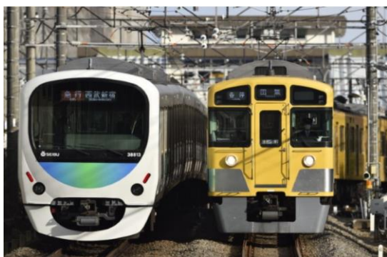
西武線の車両イメージ