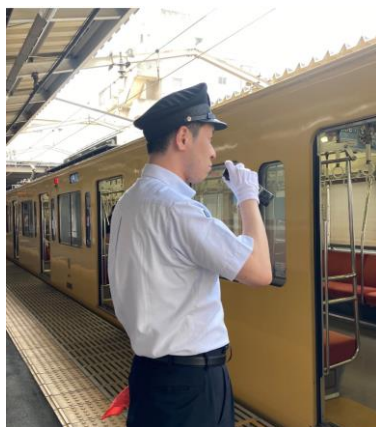
ホーム業務のイメージ