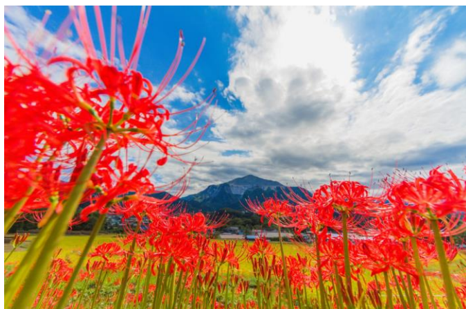
リコリス(イメージ)

リコリスが最盛期を迎えるこの時期、西武線沿線におでかけしてみたいはいかがでしょうか。