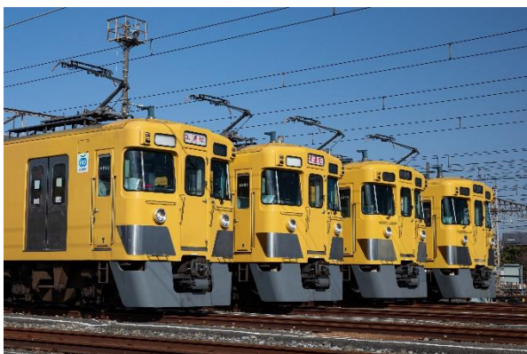
前回の「前パンを撮ろう！」撮影会の様子 （午前の部）