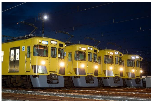
前回の「前パンを撮ろう！」撮影会の様子 （夜間の部）