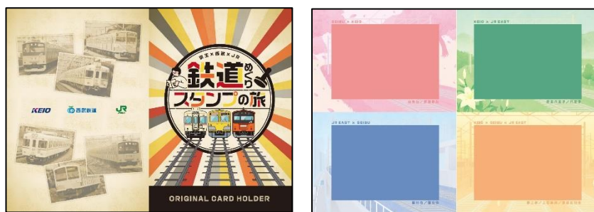
《オリジナルカードホルダーイメージ》

※スタンプ設置時間や達成賞受取時間はそれぞれ異なりますので、ご利用の際は事前にご確認ください。