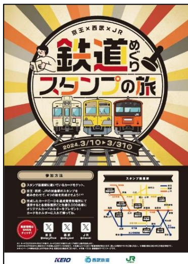
《ポスターイメージ》