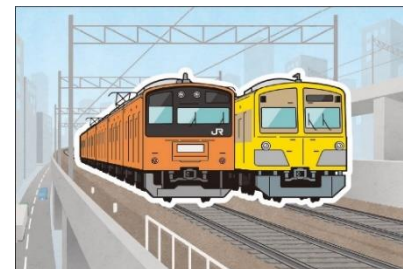
カード完成イメージ