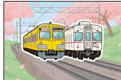
カード完成イメージ