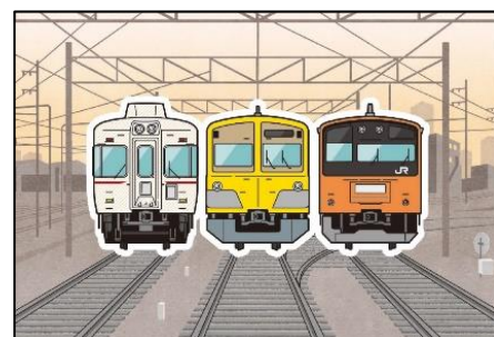
カード完成イメージ