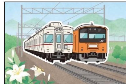
カード完成イメージ