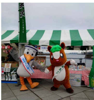
横浜市中区民まつり ハローよこはま出展の様子