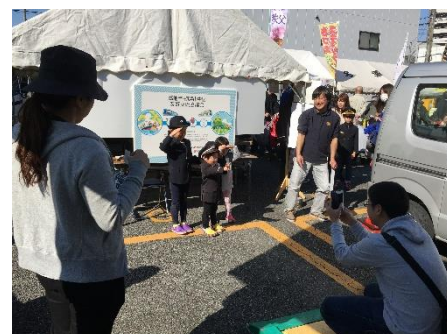
飯能まつり出展の様子