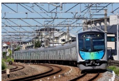
有料座席指定列車「S-TRAIN」

本ツアーでは、全席指定の有料座席指定列車「S-TRAIN」で飯能駅と元町・中華街駅間を乗り換えなしで快適に移動し、横浜港クルーズや横浜中華街での昼食、元町ショッピングストリートでのお買い物等、一日で横浜市中区の見どころを巡っていただきます。