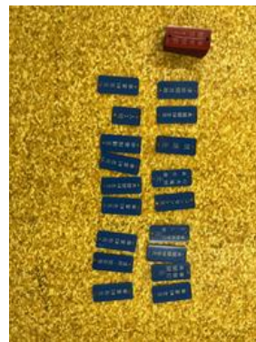
車両機器スイッチ銘板