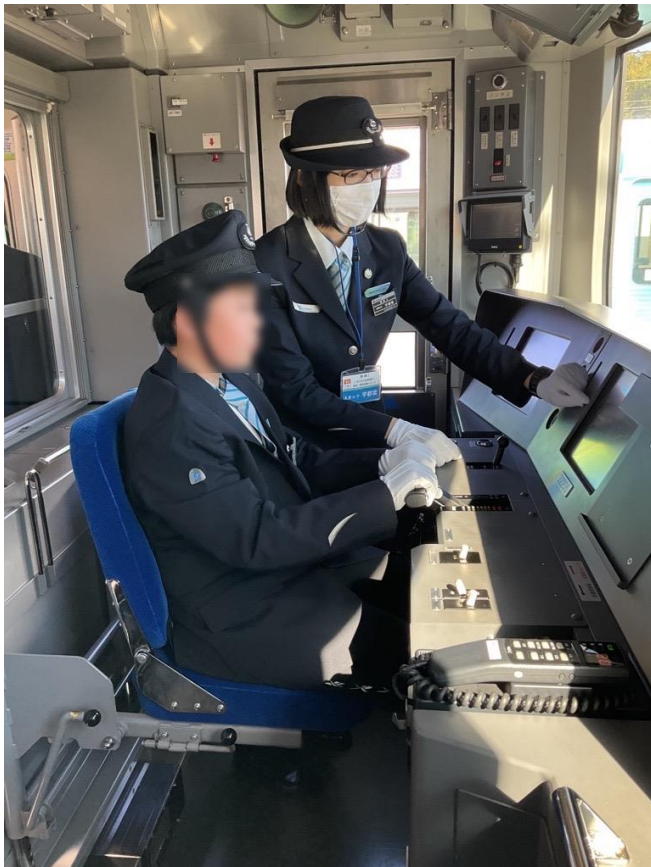
運転体験風景 *イメージ