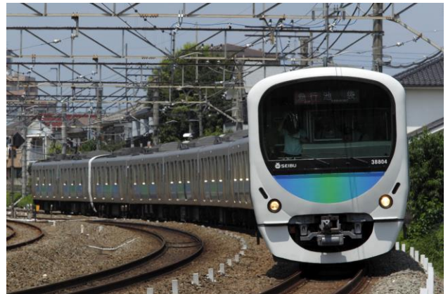
運転体験する「30000系車両」