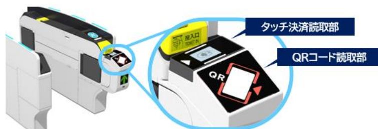
<自動改札機のイメージ>