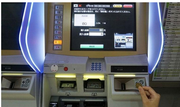
自動券売機でのきっぷの買い方

今後、通学などで電車を利用するお子さまが、楽しく電車の乗り方を覚え、また普段見ることができない電車の運転室に入り、記念撮影を行うなど各体験と現役駅係員との交流を通じて、学びと思い出となる一日となれば幸いです。皆さまのご参加を心よりお待ちしております。