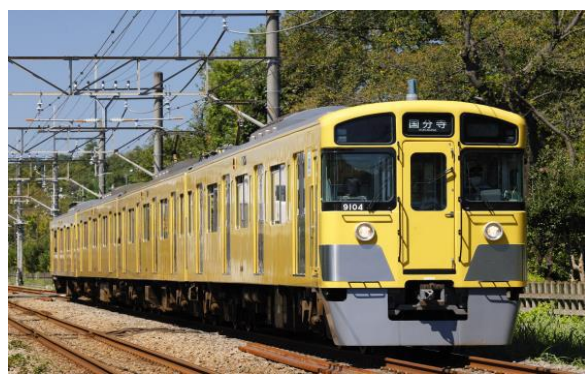
9000系の運転室で記念撮影