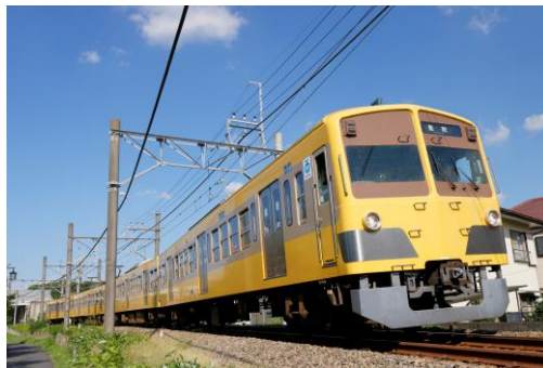
101系ツートンカラー