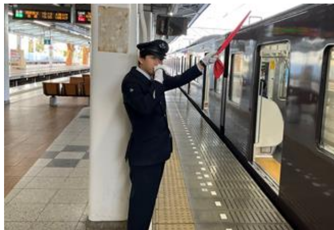
ホームでの業務風景