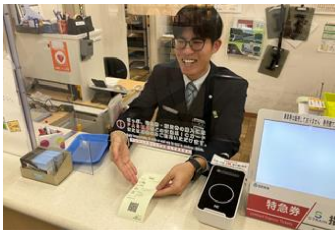
窓口での業務風景

ご参加いただいた方には 当社オリジナルグッズとカットトrolley線をプレゼント します。また、西武鉄道キッズクラブ会員の方には、表紙が硬券(昔のきっぷ)と同じ紙でできたオリジナルノートをプレゼントします。