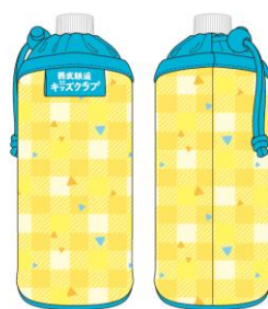
オリジナルペットボトルカバー (チェック柄)