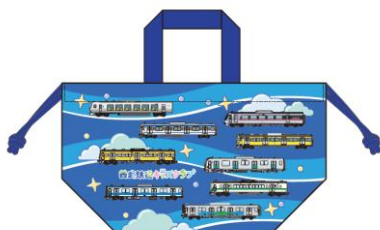
オリジナル巾着袋(電車柄)