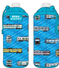
オリジナルペットボトルカバー (電車柄)