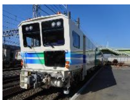
マルチプルタイタンパー