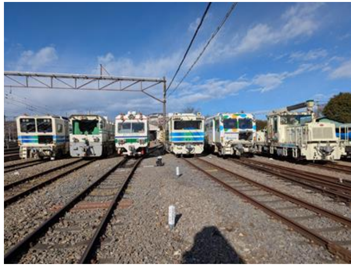
大型保線機械が全集合した撮影※イメージ