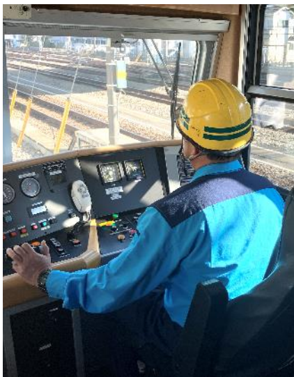
操作・運転体験の様子※イメージ

イベントの参加特典として、記念運転適任証と名札のほか、レールスライスをプレゼントします。皆さまのご参加を心よりお待ちしております。