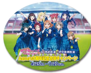
バンダイナムコフィルムワークス賞