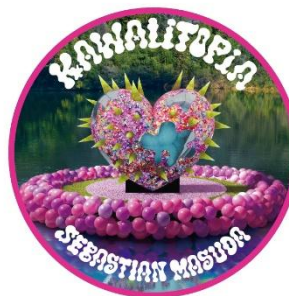
ハイパーミュージアム ver.