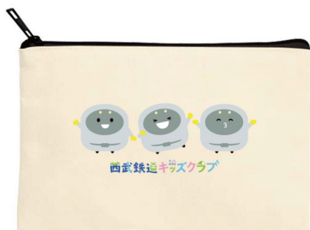
オリジナルポーチ