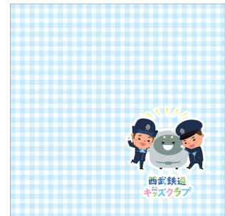
オリジナルハンドタオル

※「 オリジナルペットボトルカバー 」および「 オリジナル巾着袋 」は、 なくなり次第終了となります。