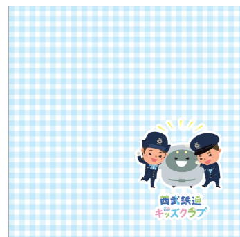
オリジナルハンドタオル