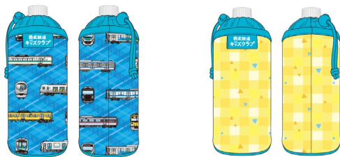
オリジナルペットボトルカバー