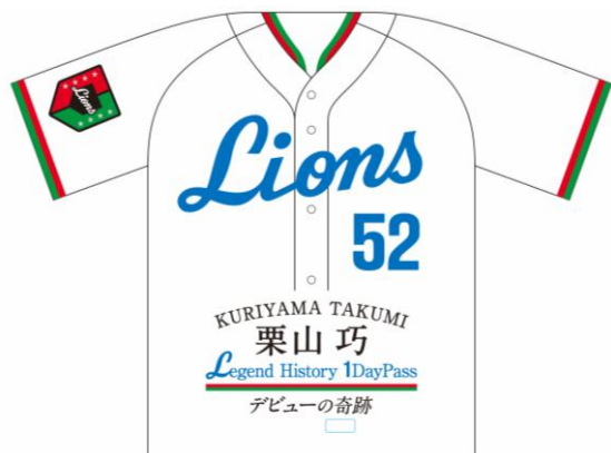
オリジナル台紙 表紙イメージ