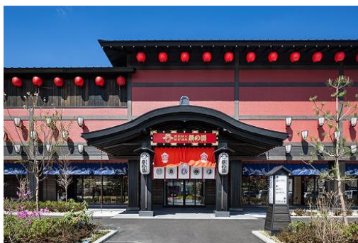
西武秩父駅前温泉 祭の湯 外観