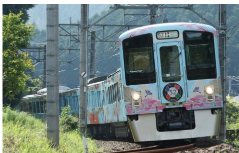
西武 旅するレストラン「52席の至福」