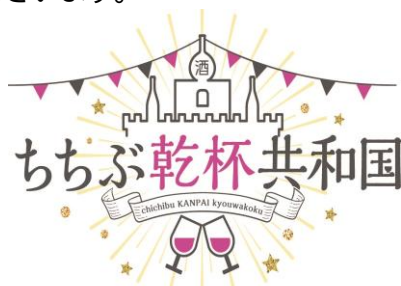
ちちぶ乾杯共和国 ロゴ

「西武秩父駅前温泉 祭の湯」について、快適にご利用いただくために入館制限をさせていただく場合がございます。