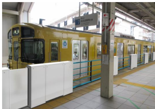
軽量型ホームドア設置イメージ (7番ホーム)