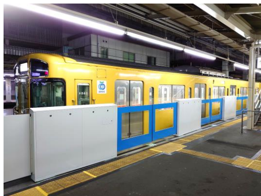
国分寺駅ホームドア設置の様子 (5番ホーム)