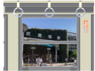
車窓風景写真のイメージ

仮想鉄道『JR 西武中央多摩川稲城鉄道』沿線の素敵な風景を写真撮影して SNS に投稿いただくと、投稿写真の中から選定し、2022 年 1 月以降に仮想鉄道の沿線 PR ポスターに活用させていただきます。ポスターは JR 中央線や西武鉄道多摩川線の駅等で掲出します。なお、イベントチラシ裏面には電車窓枠に見立てたデザインを掲載しておりますので、窓枠に沿って切り取り、窓枠越しに写真撮影すると、車窓風景のような写真が撮影できますのでご活用ください。