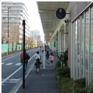
リアル電車ごっこ (2021 年 2 月 27 日実施時)