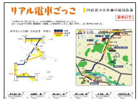
きっぷ風散策MAPイメージ