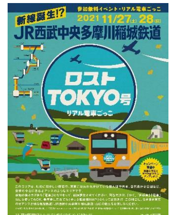
ポスタービジュアル

※11月29日以降、入缺は行いませんが、「きっぷ風散策MAP」はチェックポイントの駅等にて配布を行いますので、当日ご参加いただけない方も、散策にご活用ください。(なくなり次第終了)