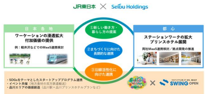
連携コンセプト「新たなライフスタイルの創造×地方創生」

(1) 新しい働き方・暮らし方の提案、(2) 街づくりに向けた長期的な連携、(3) 沿線活性化に向けた連携の 3 つを軸に、包括的に様々な取り組みを進めています。今回は、(3) 沿線活性化に向けた連携の一環です。