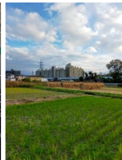
仮想鉄道『JR 西武中央多摩川稲城鉄道』の沿線