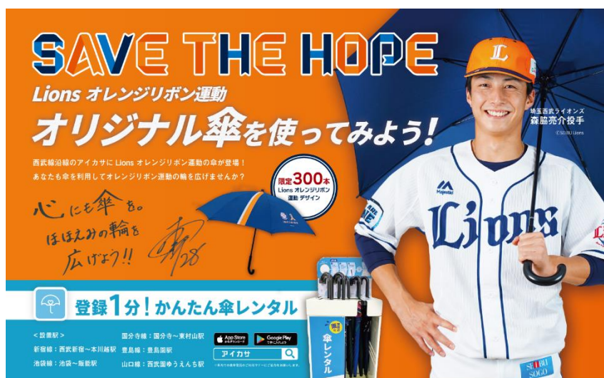
埼玉西武ライオンズの森脇亮介投手をモデルに起用した告知ポスター