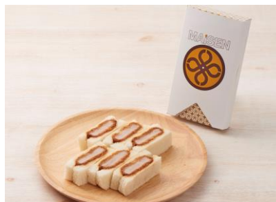
“まい泉 ヒレかつサンド”