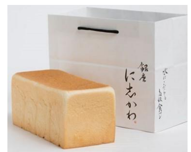
“銀座に志かわ 食パン”