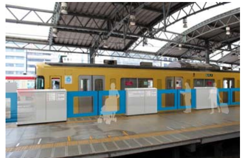
ホームドア設置イメージ

その他のホームドアの設置は、2016 年度 3 番ホームから順次設置し 2017 年度末完了予定です。