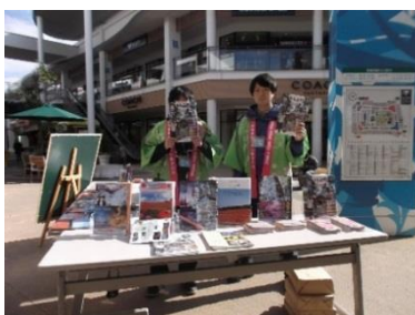
キャンペーンイメージ