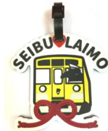
限定ノベルティ（旅行用ネームタグ）

指定の交換場所で当日有効の「小江戸・川越フリークーポン」をご提示いただくと、もれなく「西武鉄道×LAIMO オリジナル限定グッズ」をプレゼントします。