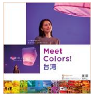
PR パネル展示(イメージ)