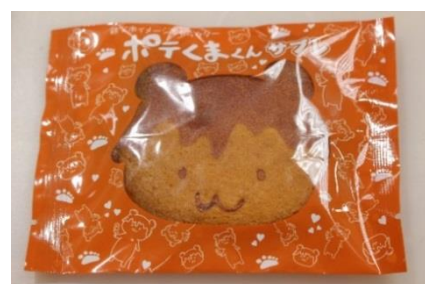
ほんのり味噌味の「ポテくまくん」サブレ