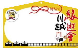
限定ノベルティ（絵馬シール）