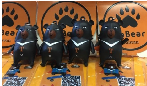
ノベルティ(イメージ)