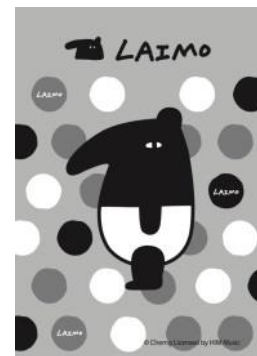
サイン付き LAIMO ハガキ