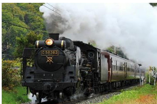
秩父鉄道 SL パレオエクスプレス