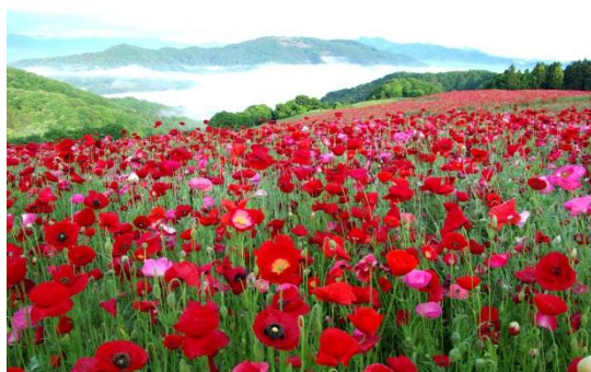
皆野町「天空のポピー2017」