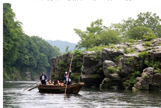
長瀨ラインくんだり