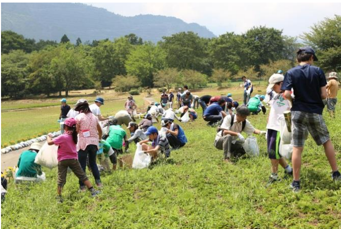
第 2 回環境活動で除草作業した「羊山公園 芝桜の丘」