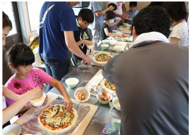
「吉田元気村」本格窯でのピザ焼き体験