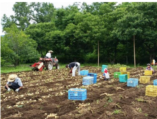
環境活動では初めて訪れる「秩父ふるさと村」

この機会に西武線沿線の自然を満喫するとともに、楽しいひとときをお過ごしください。 詳細は、別紙のとおりです。