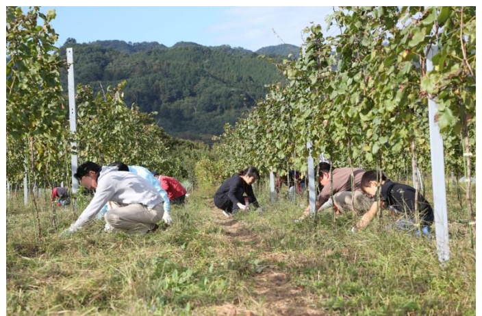
除草作業を行う「兎田ワイナリー」のぶどう畑