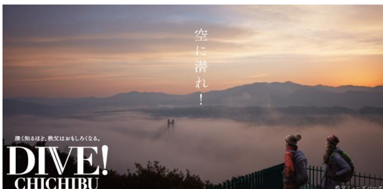
秩父観光PR「DIVE! CHICHIBU」(イメージ)