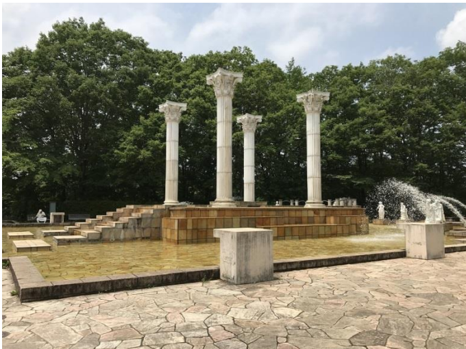
噴水などの清掃作業を行う「ミュージズの泉」

豊かな森の恵みを味わえるカフェやショップなどを併設し、五感で体験できる秩父のメープルブランドの発信拠点となっている。