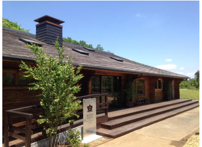
メープルシロップの製作施設見学を行う「メープルベース」