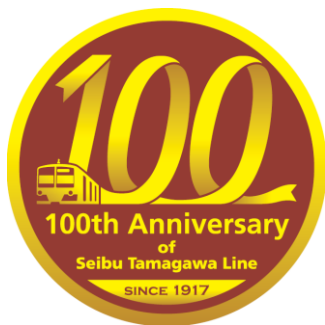
多摩川線開業 100 周年ロゴマーク