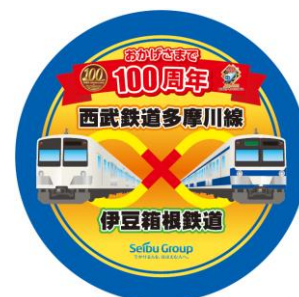
伊豆箱根鉄道コラボレーションヘッドマーク （デザインイメージ）