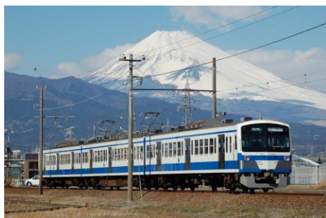
伊豆箱根鉄道 1300 系