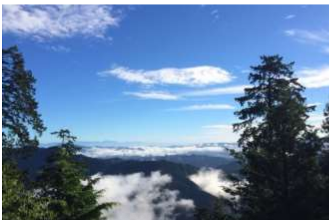
長時間続いた雲海 午前7時を過ぎても広大な雲海が継続しました。 広大な雲海を長時間見られた幸運な日でした。