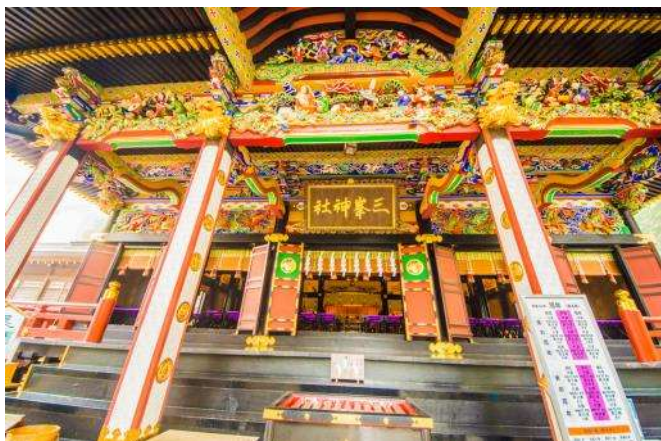
三峯神社 拝殿 豪華絢爛な三峯神社の拝殿。ツアー参加者は拝殿の中へ入り早朝に特別なご祈祷を受けられます。