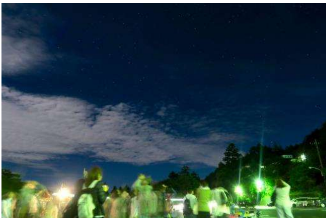
スターパーティ 午前3時頃には満天の星を満喫できました。 ※高感度設定のカメラで撮影しています。