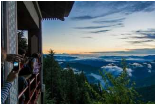
日の出前の空と雲海 午前5時頃には朝焼けと雲海のコラボレーションを鑑賞することができました。