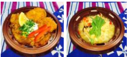
【左】 秩父わらじ豚味噌汁(ミニサイズ)