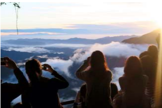
日の出の瞬間 午前5時過ぎには稜線から太陽が昇り、お客さまから思わず感動の声が上がるほどの絶景でした。