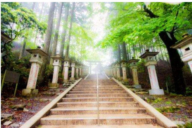
霧に包まれた三峯神社 あたり一面が深い霧に包まれた様子。神の靈気が宿ると言われ、神秘的な雰囲気には満ちています。