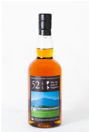
イチローズ・モルト「52席の至福」 プライベートボトル 2018