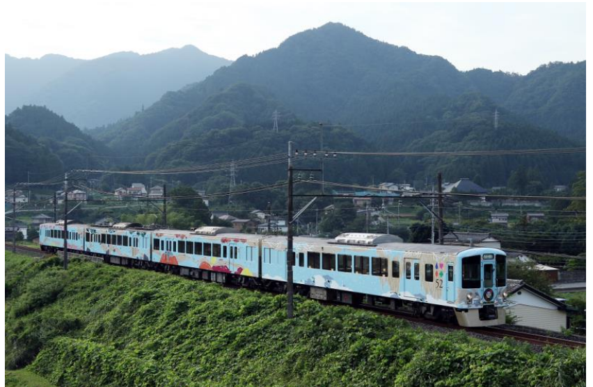
52席の至福（芦ヶ久保～横瀬駅間走行）