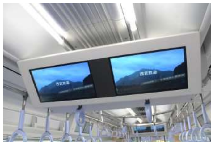
Smile ビジョン(中づり部) ※40000系の一部車両