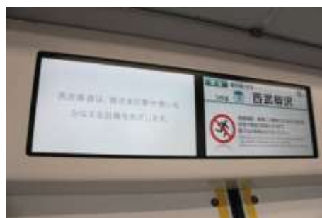
17インチ(16:9)ワイド画面