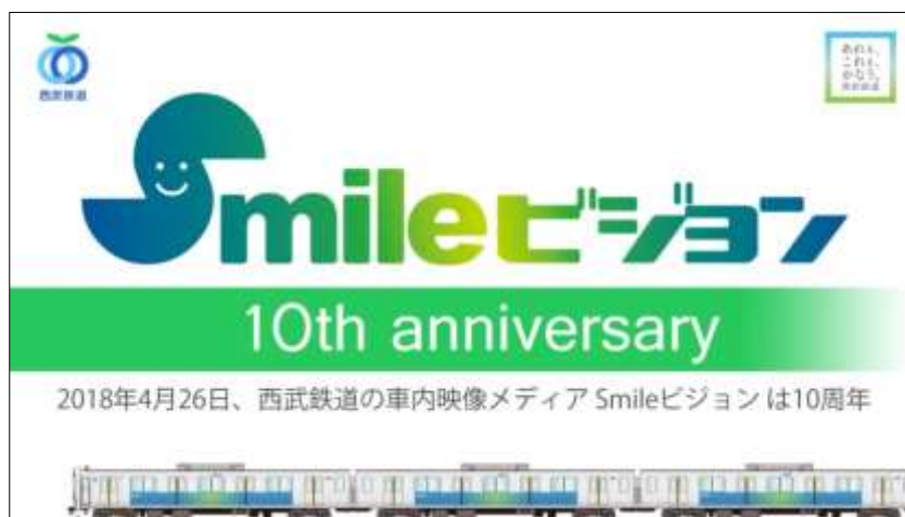
告知画像(Smile ビジョンで放映予定)