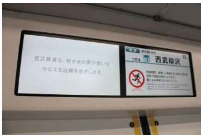
Smile ビジョン(ドア上部・左側画面) 17インチ・ワイド画面