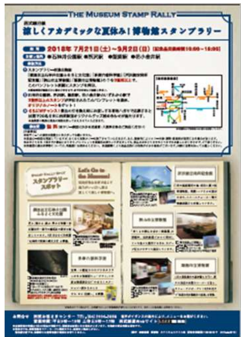
「涼しくアカデミックな夏休み！博物館スタンプラリーパンフレット」