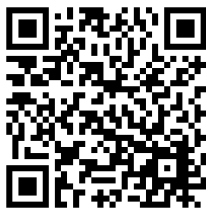
特設 Web サイト QR コード

特設 Web サイトでは本キャンペーンの詳細情報を掲載するほか、オリジナルチラシでは紹介しきれない川越のおすすめ施設、オリジナルアニメーションなど Web サイトでしか得られない情報を繁体字で随時更新します。Web サイトの公開は2018年10月末頃を予定しております。