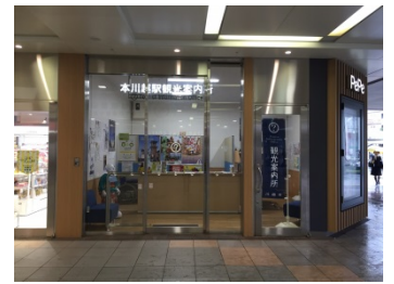
本川越駅観光案内所