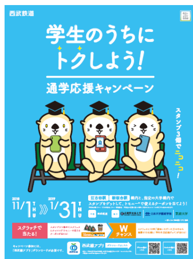
キャンペーンポスターイメージ