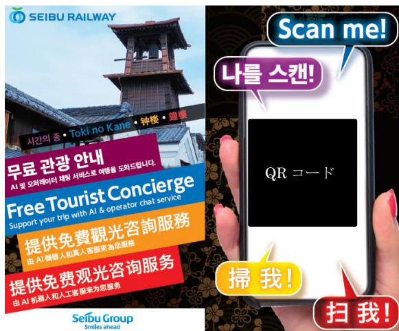
「tripla チャットボットサービス」パンフレット