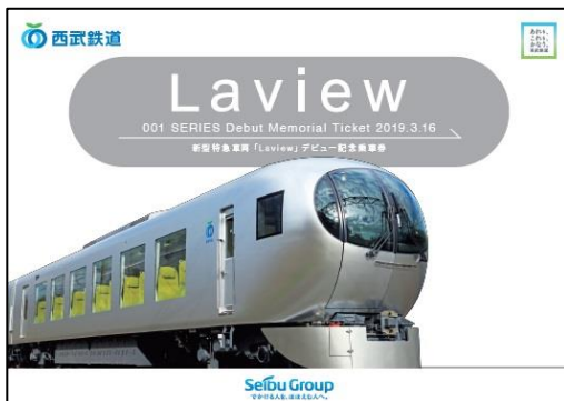
「新型特急車両『Laview』デビュー記念乗車券」 (イメージ)