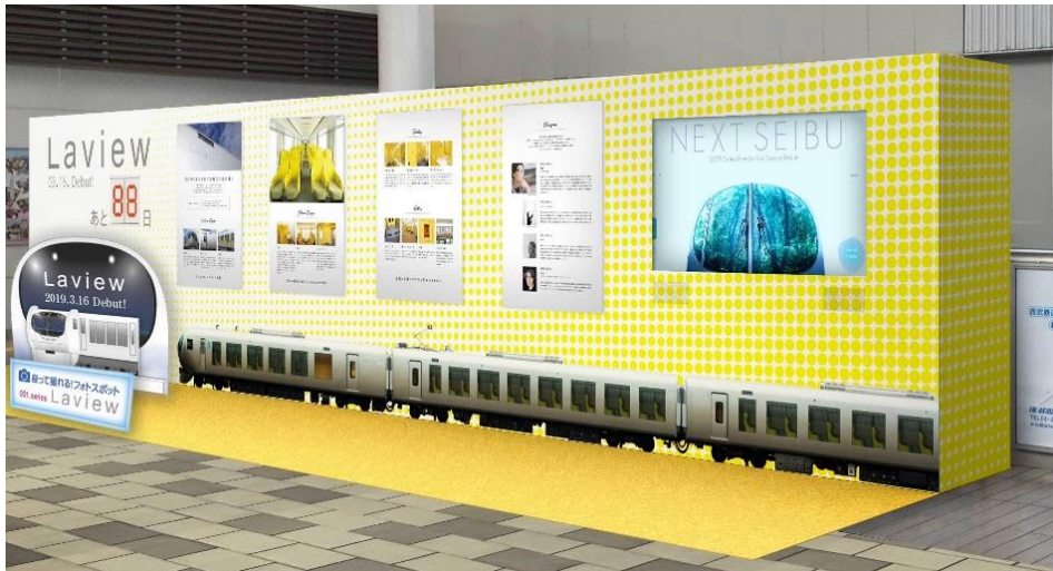
「新型特急車両『Laview』特設ブース」(設置イメージ)