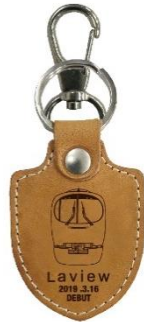
Laview レザーキーホルダー