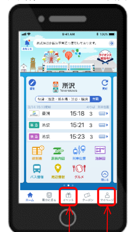
イベント マイページ

<5>「電子入場券」の配付開始時間になると、「電子入場券発行」ボタンがタップできます。ご希望の日時を選択、ご利用人数を入力して「発行」ボタンを押すと電子入場券が発行されます。