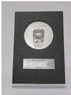
Laview デビュー記念メダル