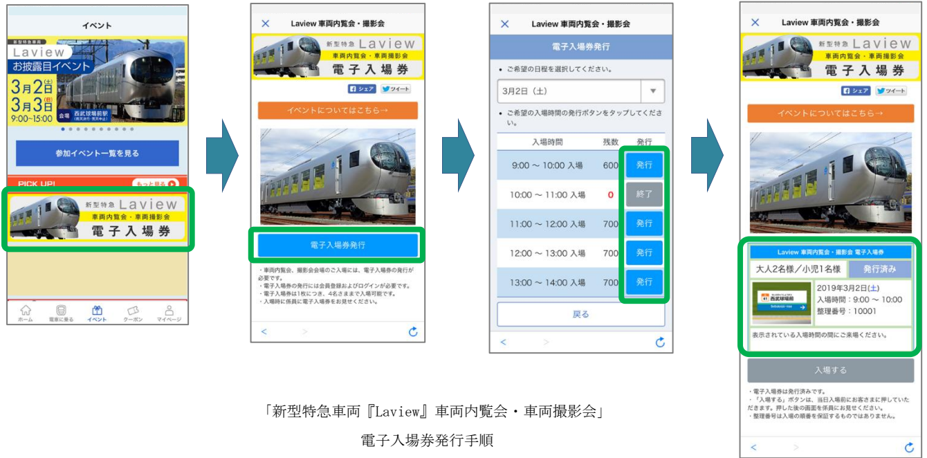
「新型特急車両『Laview』車両内観会・車両撮影会」