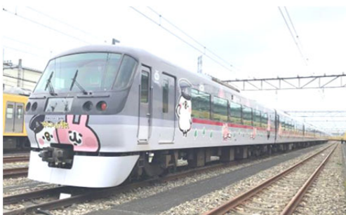
ラッピング電車（正面）

当社では、今後も川越市と協力のうえ川越エリアへの誘客を進めてまいります。 詳細は、別紙のとおりです。