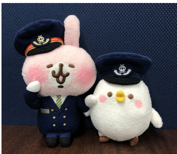
ぬいぐるみ（左：うさぎ、右：ピスケ）

「ピスケ」と「うさぎ」が川越まで「西武鉄道の電車に乗って行こう」というテーマが描かれた台紙付き乗車券。乗車券を取ると、絵馬になります。川越には、神社やお寺が有数。「ピスケ」と「うさぎ」のように、これに願い事を書いておくと、願いが叶うかもしれません！