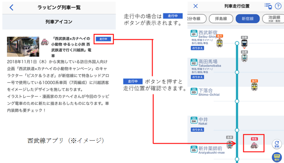
西武線アプリ（※イメージ）