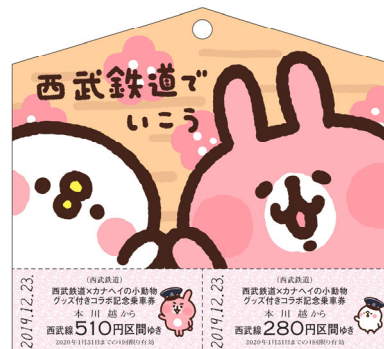
絵馬型のコラボ記念乗車券