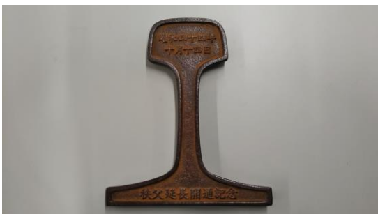
記念品：50 年前に配布されたレール型文鎮