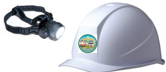
記念品：ロゴ入りオリジナルヘルメット&amp;ライト(イメージ)