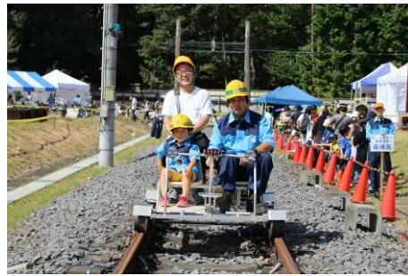
トンネル内で乗車体験するレールスター