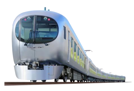
ツアーの臨時電車に使用する「特急ラビュー」