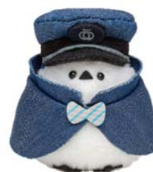
手のりぬいぐるみ 駅員 邪エナガさん よこシマ