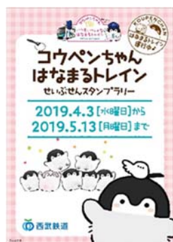
ラリーシートイメージ

2019年4月3日（水）～2019年5月13日（月）の期間、『「コウペンちゃんはなまるトレイン」西武線スタンプラリー』を実施し、達成賞として「コウペンちゃんデザインのオリジナルリングノート（A6サイズ）」をプレゼント。