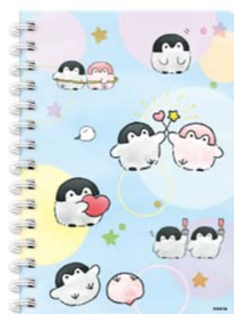
※コウペンちゃんデザインの オリジナルリングノート（A6サイズ）