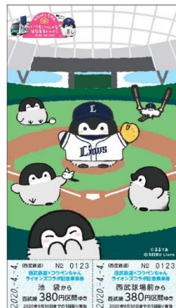
記念乗車券イメージ

そこで皆さまのご声援にお応えして、新たに 3 月 22 日（日）から約 1 年間、「西武鉄道×コウペンちゃん もっと！いつもいっしょな はなまるトレインキャンペーン」の実施を決定しました。新ラッピング電車の運行などさまざまなコラボレーション企画を実施してまいります。詳細は、決まり次第、順次お知らせします。