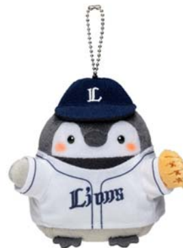
ぬいぐるみイメージ