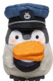
手のりぬいぐるみ わらじかつコウペンちゃん