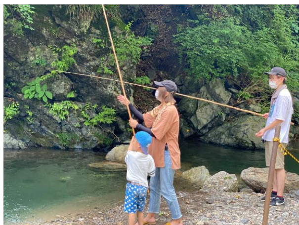
「マス釣り体験」の様子

この夏、池袋駅から乗換えなしで行ける大自然の芦ヶ久保&横瀬で過ごされてみてはいかがでしょうか。詳細は、別紙のとおりです。