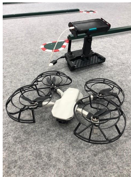
ドローン操縦体験