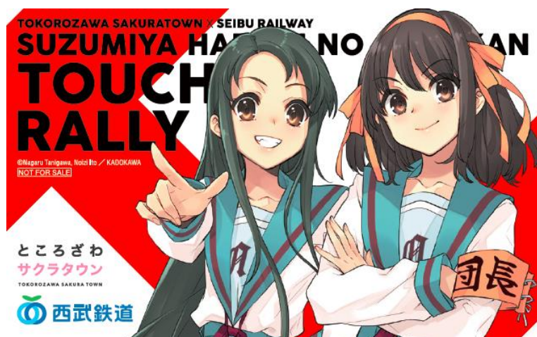
オリジナルステッカー