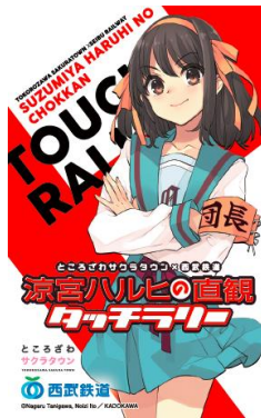
ラリー参加カード 「涼宮ハルヒ」デザイン池袋 ver