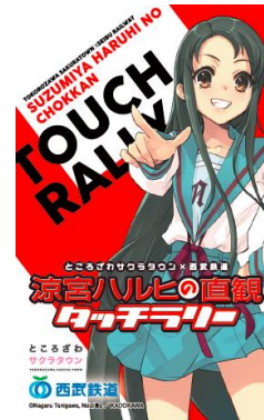
ラリー参加カード 「鶴屋さん」デザインダ・ヴィンチストア ver